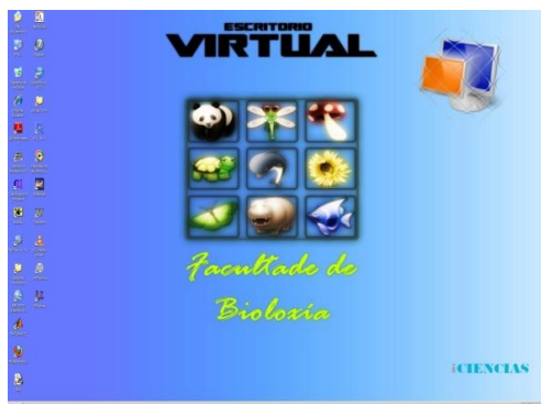
Vista do escritorio virtual: Biología.

O acceso ó escritorio remoto modificouse de forma que fora o máis automático posible. Neste momento unha vez acendido o ordenador, e en cuestión minutos, deberíamos obter unha pantalla como esta: