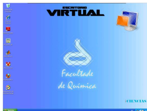
Vista do escritorio virtual: Química.